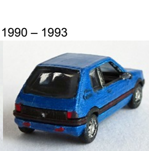
1990 – 1993