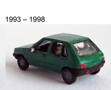
1993 – 1998