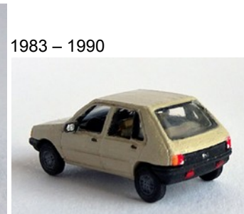
1983 – 1990