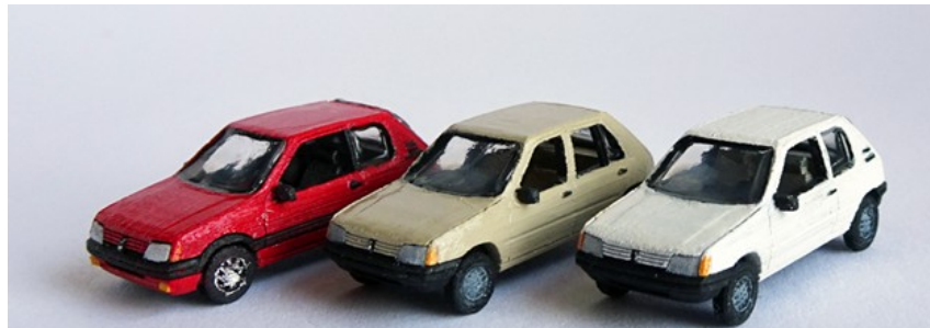
1983 – 1990