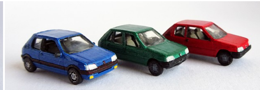
1990 – 1998